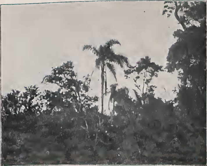
Habitats no Distrito de Itaquaquecetuba, Estado de São Paulo